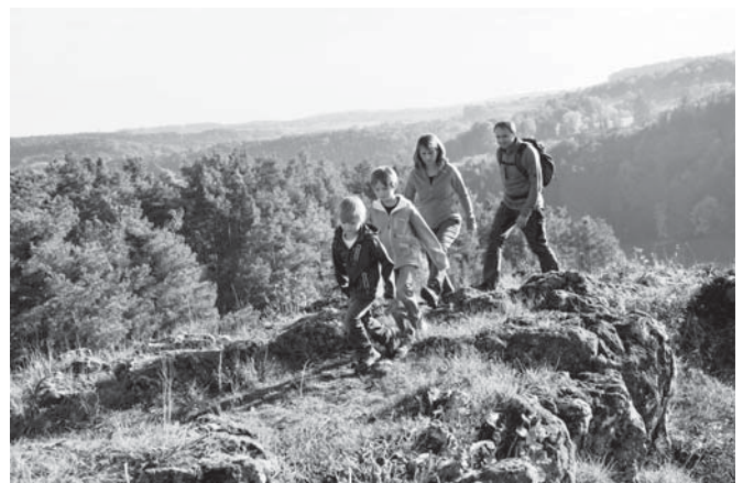
Der Burgensteig im Tal der Schwarzen Laber – Wandervergnügen für die ganze Familie

Den Burgensteig säumen mittelalterliche Burgen und Burganlagen wie die imposanten Burgruinen von Laber und Ehrenfels sowie die – in unserer Region äußerst seltene – Höhlenburg in Loch. Diese erzählen von der ereignisreichen Geschichte dieser jahrhundertealten Kulturland-