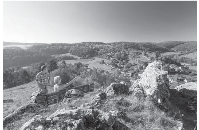
Hoch über dem Tal der Schwarzen Laber bieten sich herrliche Ausblicke.

Nach einer fünfmonatigen Abstimmungsphase ist der Wettbewerb „Deutschlands schönster Wanderweg 2020“ am 30. Juni 2020 mit 63 Bewerbungen zu Ende gegangen. Bereits zum 16. Mal hatte die Zeitschrift Wandermagazin den Wettbewerb in den Kategorien Touren und Routen ausgeschrieben. Mit 15 600 Abstimmungs-Teilnehmern erreichte der Wettbewerb in diesem Jahr eine neue Rekordzahl.