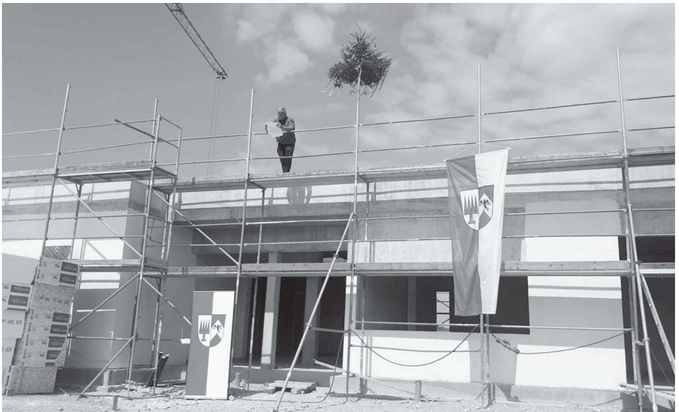
Richtfest neuer Kindergarten in Köfering

Nach Erhalt Ihrer Wahlbenachrichtigung haben Sie auf der Homepage der Gemeinde Köfering www.koefering.de die Möglichkeit schnell und einfach die Dienste des Bürgerservice-Portals zu nutzen.