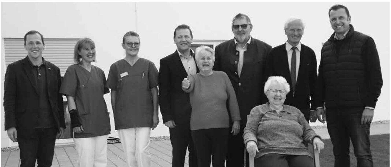
Die ersten beiden Bewohnerinnen mit dem Bürgermeister, Vertretern der Gemeinde und dem BRK Team samt Geschäftsführer.