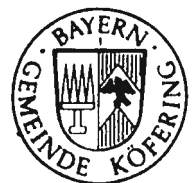
Armin Dirschl 1. Bürgermeister