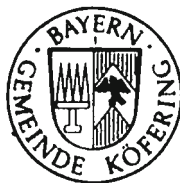
Armin Dirschl 1. Bürgermeister